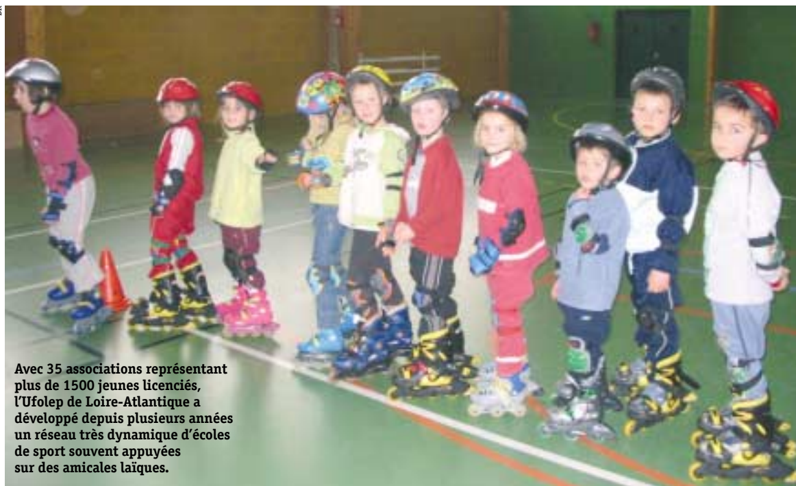
Avec 35 associations représentant plus de 1500 jeunes licenciés, l'Ufolep de Loire-Atlantique a développé depuis plusieurs années un réseau très dynamique d'écoles de sport souvent appuyées sur des amicales laïques.