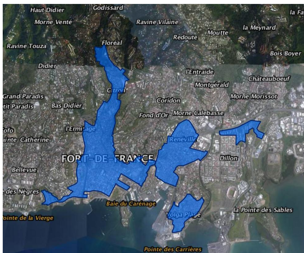
Territoire du Contrat de Ville de Fort de France – 2015

Pour cela, nous utiliserons les équipements municipaux adaptés et, par le biais de notre site Internet , des réseaux sociaux ainsi que des médias partenaires au projet, nous mettrons tout en œuvre afin d'offrir une visibilité maximale au Défi Solidaire des Quartiers .