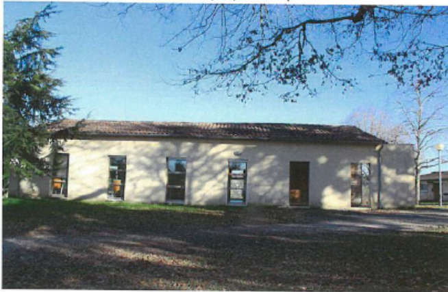
Salle d'engagement et de remise des prix