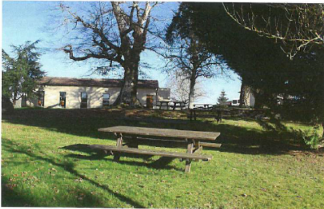
Aire de pique-nique