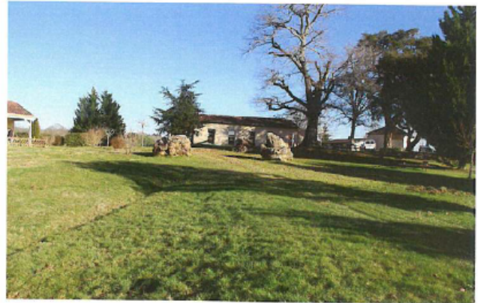
Salle d'engagement et de remise des prix