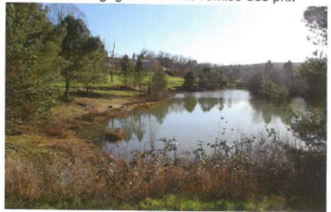
Vue du site de Gammareix