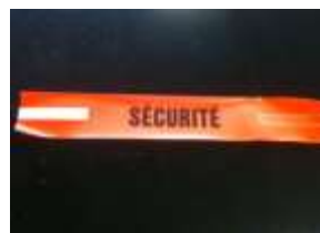
Prêt de Vélos : Uniquement pour le Projet Kid Bike